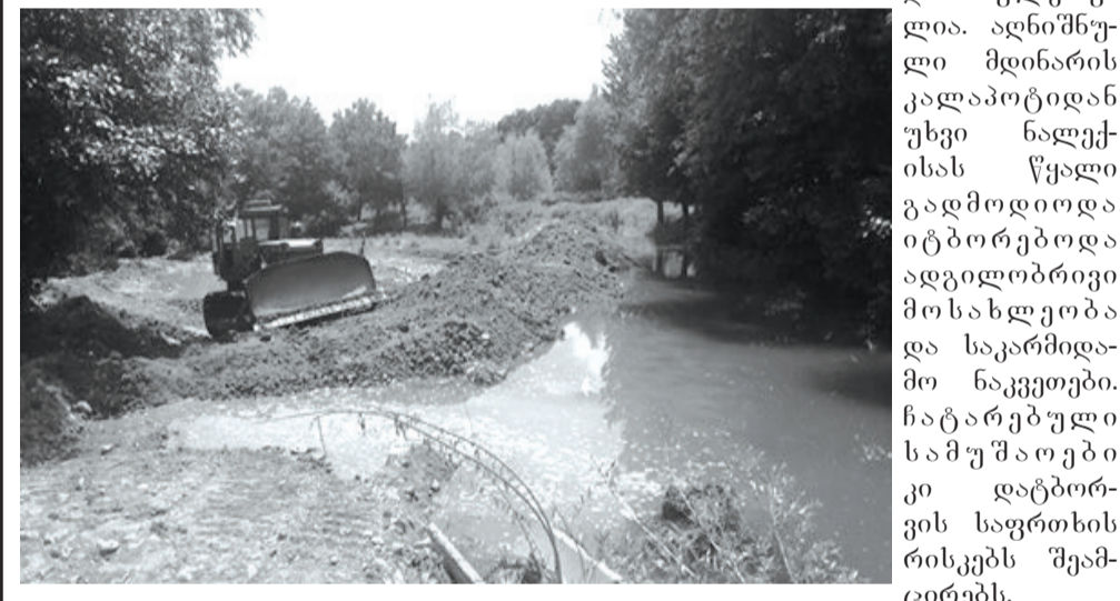
სამუშაოები ხაშურის მუნიციპალიტეტის გამგეობის დაფინანსებით განხორციელდა.

ხაშურის მუნიციპალიტეტის ალის ადმინისტრაციულ ერთეულში მდინარე ქერათხეუდას კადაპოცის 200 მ-იანი მონაკვეთის მოწესრიგების სამუშაოები დასრულდა.