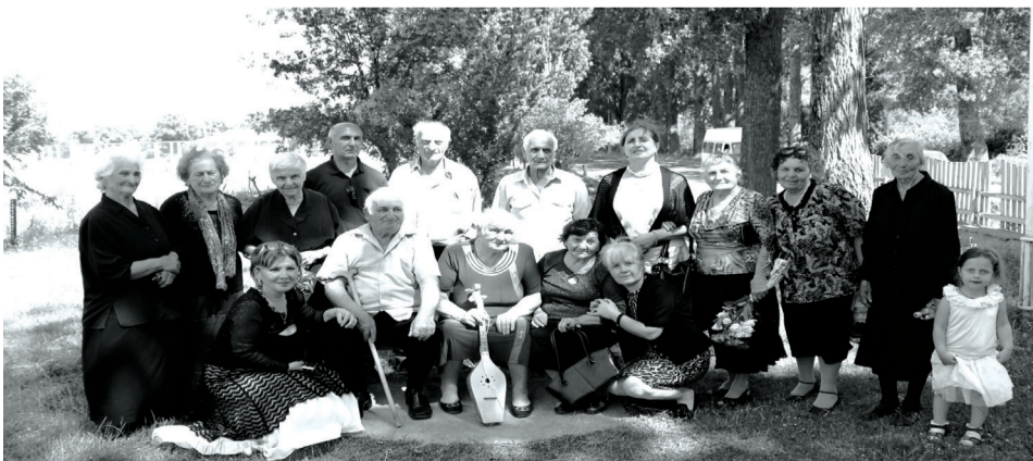
ბოდნენ და კიდევ ერთხელ ეთქვათ, რომ სიბერე ზღვის ნაპირი არაა, სადაც ხშირ შემთხვევაში, მოქცევის შედეგად გამორიყულ ნივთებს გვერდს

26 ივნისს, ქვიშხეთის კულტურის ცენტრი გვეპატივებოდა, რათა მოგვგვრე-