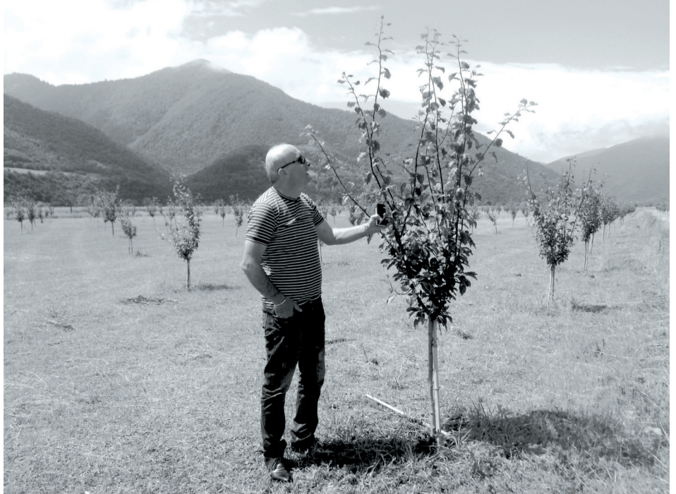
სახურება. ამ სანერგე მეურნეობაზე 5 კაცია (დასასრული V გვერდზე)

- ჩემი უმთავრესი მიზანი და პრიორიტეტი სოფლის მეურნეობის აღორძინებაა. დეტალურად მაქვს შესწავლილი გასულ წლებში რომელი კულტურების მოსავალი ხარობდა უკეთ. რომელი სოფლის ნიადაგი იყო იდეალური კარგი მოსავლის მისაღებად. რაც შეეხება ჩვენ სოფელს, კარგად მოდის პომიდორი, ბულგარული წიწაკა, ხახვი, ვაშლის და ქლიავის კულტურები. სხვათა შორის, ქლიავი ერთ-ერთი ყველაზე პროდუქტიული ხეხილია. ჩვენც, რა თქმა უნდა, ამ პროდუქტების მოყვანისკენ ავიღეთ ორიენტირაცია. ჩემი სურვილია, ყველა მოსახლემ გააშენოს ასეთი ხეხილის ბაღები. თუმცა, როდესაც მათ ამ ინიციატივის შესახებ ვამცნობ, მეკითხებიან თუ როგორ მოახდინონ მოყვანილი მოსავლის რეალიზაცია. იმისათვის, რომ მოსახლეობას ეს კითხვა აღარ გასჩენოდა, ჩვენ ავაშენეთ საწარმო, რომელიც გადაამუშავებს და გააკეთებს ჩირს, საწარმო თითქმის ბოლომდეა აშენებული, გარკვეული სამუშაოებია დარჩენილი. სხვათა შორის, ამ შენობის აშენების შემდეგ ძალიან ბევრს გაუჩნდა სურვილი ამ კულტურის გაშენების, მეც, ჩემი მხრიდან, ვეხმარები როგორც