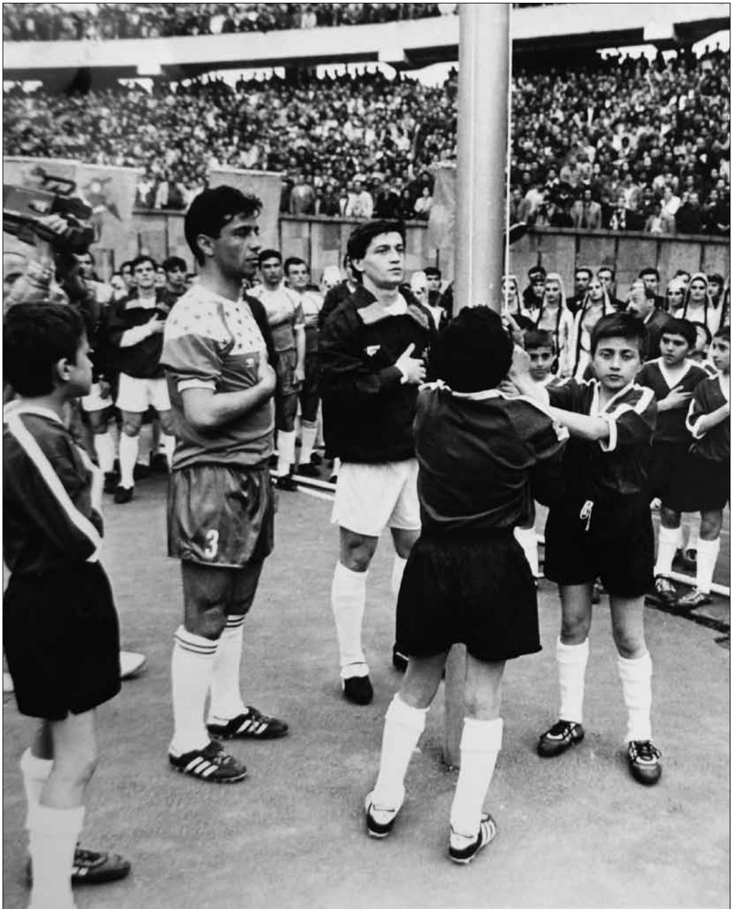
პირველი დამოუკიდებელი ეროვნული ჩემპიონატის პირველი მატჩის (თბილისის «დინამო» — ფოთის «კოლხეთი») საზეიმო გახსნის ცერემონიალი. თბილისი, 1990 წელი