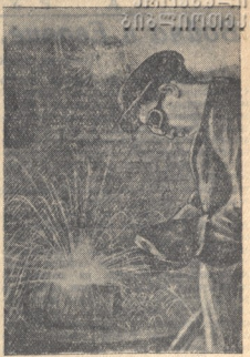
Ученики школы №30 им 4 Молодецкого района Грозного Султана Япия-тоу, славный экзамен на государственную 5-го разряда.

М. КАРВОНСКИЙ, инструктор сельхозотдела Чес.-Инг. обкома ВКП(б).