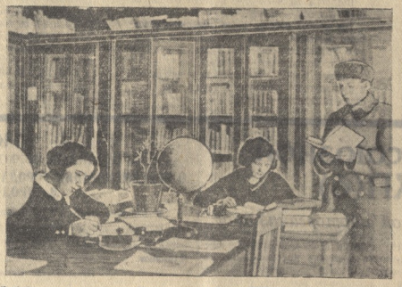
В библиотеке партгазета Молодцового района ВКП(б).

П. КРАВЧОВ, секретарь Чечено-Ингушского обкома ВЛКСМ.