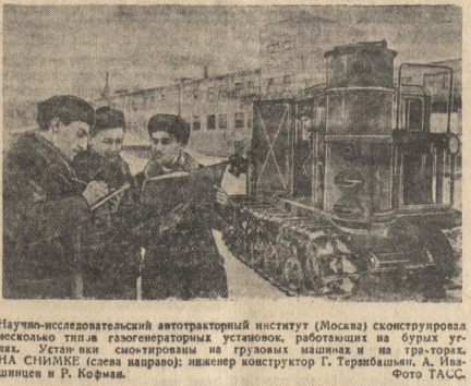
Научно-исследовательский автотранспортный институт (Москва) сконструировал несколько типов газогенераторных установок, работающих на бурных углях.

безызвестия в атмосферу, жарку в больших затратах на топливо и задымление всего глубоководного оборудования недостатком.