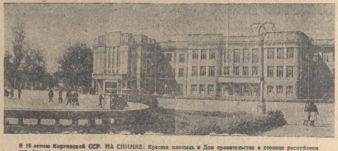
К 15-летию Кыргызской ССР. НА СНИМКЕ: Красная площадь и Дом правительства в столице республики Фрунзе.