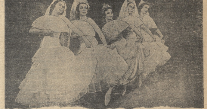
Искусство в новых советских республиках. Премьера оветы «Джигренк» (музыка Крейна в Государственном театре оперы и балета Латвийской ССР (Рига), НА ЦИМКАЕ, труппа с похрычлами.

Военные действия в Аلبании НЬЮ-Йорк, 1. (ТАСС). Агентство Ассошиэтед Пресс сообщает, что по сведениям военных кругов, итальянские эвакуированные Тезико.