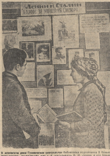
В дни оккупации дома Грозненской центральной библиотеки подготовили 5 больших фотопанорам, отражающих жизнь и деятельность В. И. Ленина и его ближайших соратников. НА СНИМКАХ: в центре...