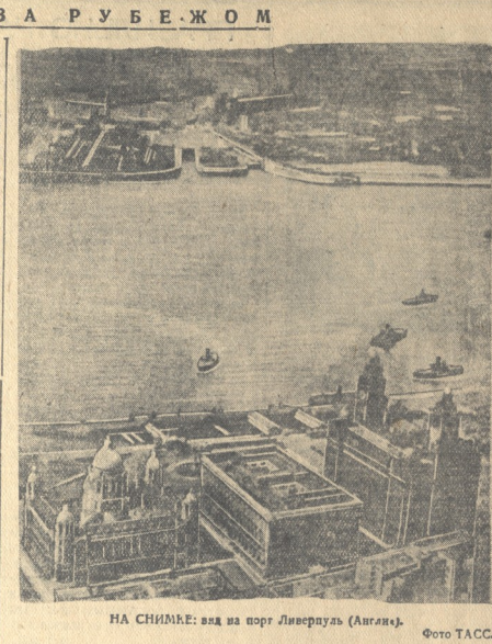
НА СНИМКЕ: вид на порт Ливерпуля (Англия).