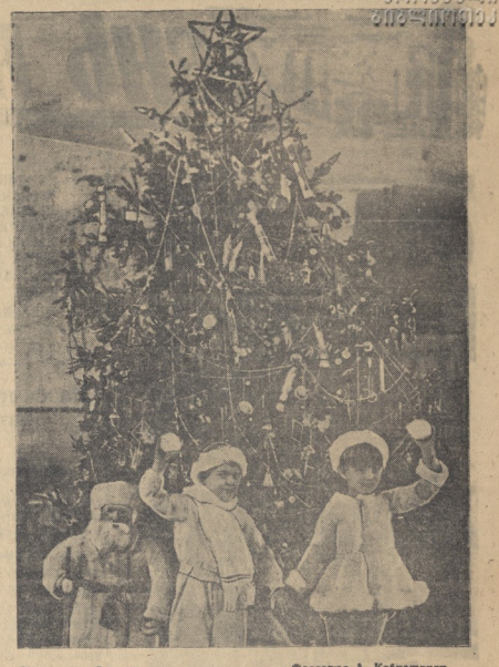
У новогодней елки.

Капиталистические страны все свои материально-технические средства направляют на дальнейшее разрывание войны.