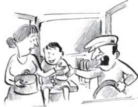
კალთაში გადაინაცვლა, ჩემი თანამგზავრი