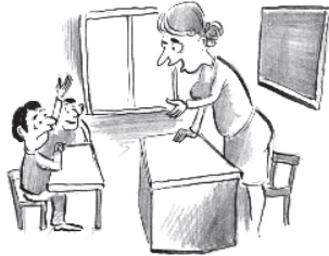
ლოც ხომ იგივე წინადდებოდა და... აპატია...

ეს ამბავი მართლა მოხდა ახალციხის სკოლაში. ახალბედა ია მას-ნაულელებმა მორიგე გაკვეთილზე ასეთი შეკითხვა დაუსვა პირველელახელებს: