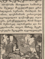
ბიძის საიდეო გადაწყვეტის ტელევიზიისთვის