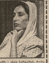
გვერდითი მხარის დახმავა