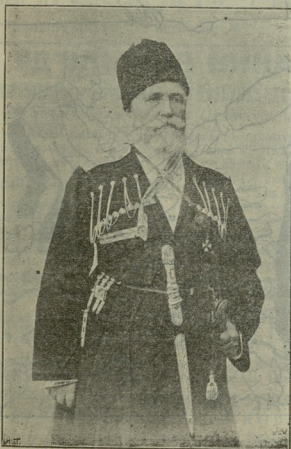
Помощ. Намѣстника Кавказа ген.-л. Я. Д. Малама.