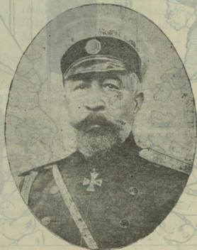
Генералъ-лейтенантъ Г. Н. Назбекъ