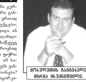
მოზულეთის ბაზრის მფლობელი.