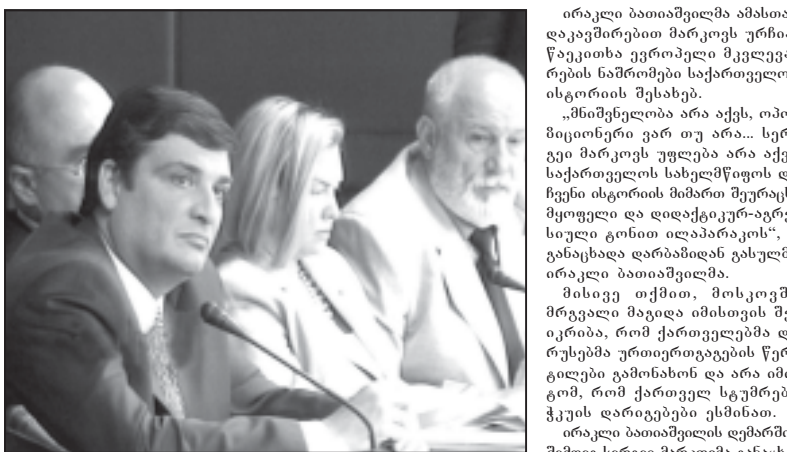
მოსკოვში საზოგადოებრივი პროექტების ინსტიტუტის ინიცინდენტი გამართა მრავალი მაგიდა, რომელშიც ქართველი ოპოზიციონერებიც მონაწილეობდნენ.