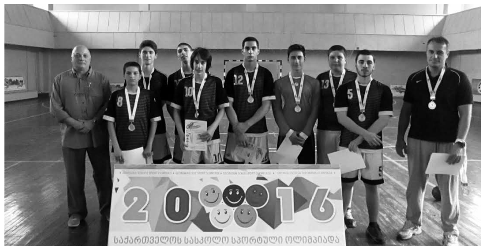
თბილისის 161-ე საჯარო სკოლის გუნდი

ასპარეზობის უფლება მესტიელმა და წყალტუბოელმა ფრენბურთელებმა მოიპოვეს. საბოლოო გამარჯვება იმერლებს დარჩათ: მალაკელებმა ჭუბერის გუნდს 2:1 (15:17; 16:13; 15:4) მოუგეს და დასავლეთ საქართველოს ჩემპიონები გახდნენ. წყალტუბოელთა გამარჯვებით დასრულდა გოგონების ტურნირიც და საინტერესოა, რომ ფინალში მათაც მესტიელებს მოუგეს 2:0 (16:12; 16:10). იმერეთს, ამჯერად, წყალტუბოს მე-4 საჯარო სკოლა წარმოადგენდა, ხოლო ზემო სვანეთს - მესტიის სოფელ ნასკარას სკოლა. ხელბურთშიც დამთავრდა ზონალური პირველობები, თუმცა მას წინ თბილისის ჩემპიონატი უძლოდა, რომელშიც დედაქალაქის კერძო და საჯარო სკოლები მონაწილეობდნენ. ეს იყო აღმოსავლეთის ზონის რეგიონული პირველობა, რომელშიც ვაჟებში 161-ე საჯარო სკოლის, გოგონებში კი 175-ე საჯარო სკოლის გუნდებმა გამარჯვეს. მათვე მიიღეს მონაწილეობა აღმოსავლეთის ზონალურ პირველობაში, რომელსაც ისევ თბილისმა უმასპინძლა.