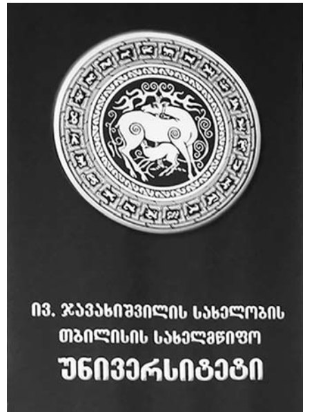
ივ. ჯავახიშვილის სახელობის თბილისის სახელმწიფო უნივერსიტეტი

ყველანი შევიკრიბეთ აუდიტორიაში და დაიწყო ლექცია. ღმერთო ჩემო, ეს იყო ჩემი პირველი ლექცია, ჩემი პირველი ნაბიჯი ახალ სამყაროში და პირველი შეხვედრა თსუ-ს პროფესორ-მასწავლებლებთან. ვუსმენდი მათ და თან მესმოდა ჩემი გულის ცემა. მიუხედავად იმისა, რომ გული ამოვარდნაზე მქონდა, სახე მაინც მიღიმოდა, თვლები მიეღვინებოდა, რომელიმე განვიცდიდი და ვგრძნობდი იქ მყოფი ადამიანებისადმი და იმ