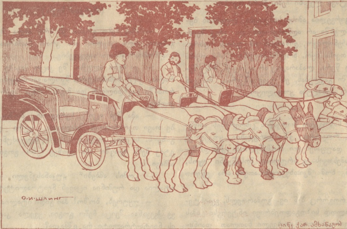
მოსალოდნელი ბირვა თფილისის ქალაქისა.