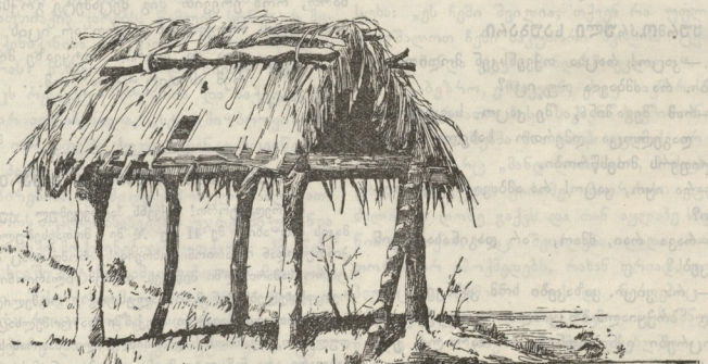
სურათი სოფლის ცხოვრებიდან.