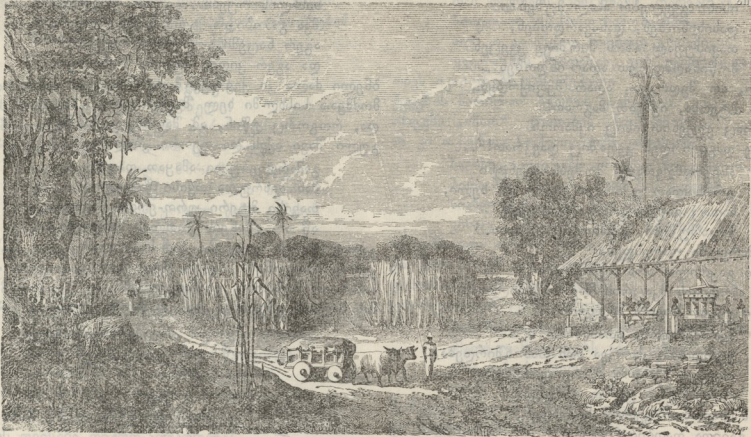
სურათი სოფლის ცხოვრებიდან.

ყია-მყარას „ღურმიშხან ულს“ ქვემაროშობაც ეხერხება.