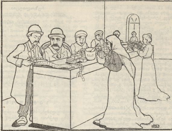
სენა ფირალოვის ქარხანაში გაფიცვის დროს.