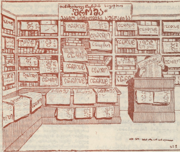
ოზურგეთის წიგნის მალაზია.