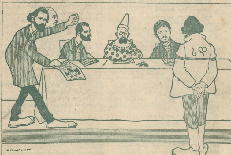
ჭეშმარიტ ქართული სამართალი.