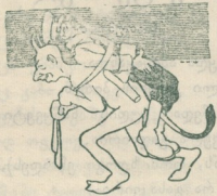
ღანჩხუთის ვაჭართა შორის.

ერისტომ უთხრა სილოვანს: პავლიამ შეგვიცდინაო, კვირის ვაჭრობაც ვგვიშა ტყუილათ შეგვარცხინაო. წყუელიც იუოს მარადის ეგ ჯიბგირი და ქურდლიო სულ ყველას როგორ ენდობა ვისაც ახურავს ქულიო“.