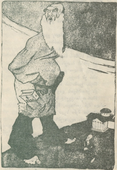
ტილისტი და ზურმუქევიჩი.

აურიშაჰიჩი. ჩვენ როგორც დიდებულ სა- ხელმწიფო მოღვაწეებს, სადა გე კლიან ისეთი უმ- ნიშნენლო საქმეებისთვის, როგორც ტოლსტოის დღეს ასწულია!