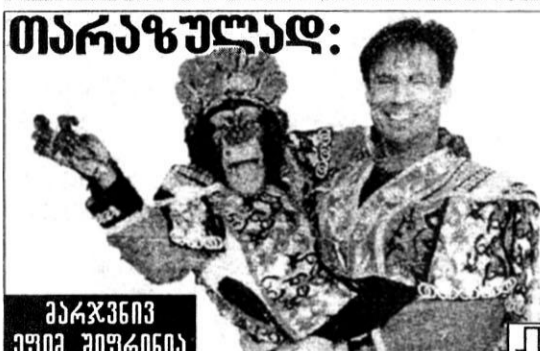
პარკინი უში უიურიანი

1. თევზის ღვე; 6. საეკლესიო ლექსების კრებული; 10. მუსიკალური ნაწარმოების ნომერი; 14. კბილი - ლათინურად; 16. შიო არაგვისპირელის („საკროსფორდო“) მოთხრობა; 17. მადრიდის „აგლევკოს“ ბრაზილიელი ფეხბურთელი; 20. ქალაქი უმბეკეთში; 22. გომ-მოდელი... ტურმანი (გნებავთ - თურმანი! ოპო-პო...); 23. საღურგლო ინსტრუმენტი; 24. ელენის მშობლიური მხარე; 25. ფულის და ადამიანების „მეხვედრა“; 29. ბერძენი „მღვთა მფლობელი“; 30. როგორ იწყება მარკ გვენის ცნობილი რომანი? 32. „პამლეტის“ პერსონაჟი; 33. ლენინის საყვარელი ხომალდი; 34. სახელმწიფო აფრიკაში; 36. სახელმწიფო ვეროპაში; 38. ქეთისის ავტოქარხნის ნაწარმი; 39. რკინიგზის სფეროს „დამსახურებელი“ მუშაკი; 42. მისანიზებული სიგევა; 43. ამერიკელი მეცნიერი; 45. ქართული სიმღერებისათვის დიდებული გეტსების შემქმნელი; 49. ირანის ფულის ერთეული; 51. რა ფეხებით ბავშვობაში ბევრი (ცუდი არაფერი იფიქროთ)? 52. იგივეა, რაც „როგორც“; 53. ნახევარკუნძული ვეროპაში; 54. „დასრულებული“ სიგევა; 56. ქალაქის მანიზებული სპარსული ბოლოსართი; 58. თეინერებისაგან შორს მდგომი; 60. გამაფხულის ბაყაყი; 63. პაპანაქების ინვენტარი; 64. ავლაბარში გასაგონი რამ (... და სხვაგანაც); 65. ცნობილი საბჭოთა-ებრაელი მედიკოსი; 66. საბჭოთა თეიმფრინავების სერია; 67. მონგანიც და სენ-ლორანცი... 68. გეომეტრიული სიგევა; 69. ქალის „საბრძოლო“ იარაღი; 71. სიგევა „ეს“ ერთ-ერთ