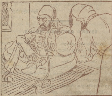
(შუბლი შეეკრა აბღულ გამიღს, სჩანს არ იამა!)

სულთანს წარუდგა ვეზირი-ხანი და მოახსენა: დიდო ხონაქარო, სჩანს ალღობა ვაგვეწერა ჩვენა! კრიტი წაიღო საბე/მწერის კამპანიაში... ჰერცოგოვინა და ბოსნია კი ავსტრიაში!!..