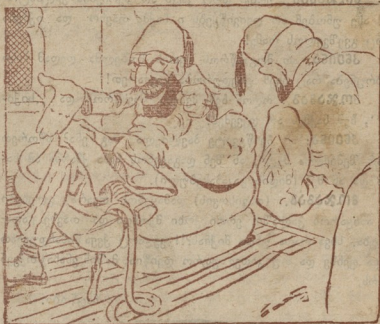
სულთანი. ეს ყველა კარგი, მაგრამ მითხარ ჩვენ რაღა ვერჩება?!

ვეზირი შეკვლილიც ემზადება და აჯანყება. დღეს თუ ხვალ იქაც იგრილებს და გაიბღვება.