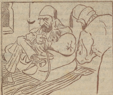
(წარბი შეკრული, აბღულ გამიღს მყის ვაეშლა, თვალში ვაუკოთა ვიძირს ხანების სასტყეო ძალო).

ვეზირი, თავი დავეკრა ბოღვარიამ და გაგვეცლა, აღბანიაში აჯანყებამ ფრთები ვაშლა..