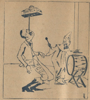
ჩვენი დროის ფაშაზები.

ფხაკუნი — შუიანდებული ვახსეუბა (შემღები ჩენება)