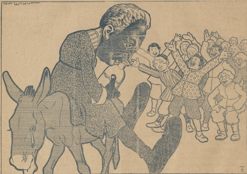
ქურდის დასჯა სოფელში ერთობის დროს,