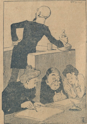
პუარიშკევიჩი. ვინ ახსენას ჯე კონსტიტუციურ? ნუ თუ მომეურთა!!!

მყიდველებს ეთობა 20 პრ. გამოწერა შეიძლება ნაღდ ფულზე და ფსადღებით. მთივარი საწყობი „შრომის“ სტამბაში, მინიელის პრ., 65.