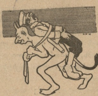
შ ე ს ვ ე რ ა ბ.