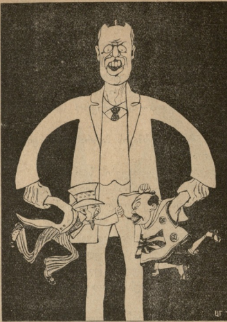
არუხველბი: —გაჩერლით თქვე ობრებო ჰაავის კონფერენციის გათავებამდე რაგომზე და მერე თუ გინდო შექამეთ ერთმანეთო.