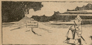
— ამ... ამ... ამ... რაც იქნება მივიღ ახლა.

აღნი წინაპართა ჩვენთა ჩვეულებასა და თავთა ზედა თვისთა ნაცრისა დაერით არა ამკრებენ ქვეყნიერებას, თუ რაოდენ დიდსა მშუხარებასა განიცდიან გულნი მათნი.