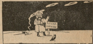
— მა... ძლივ... მოლით, მოლით კეთილ მორწმუნუნო.