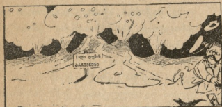
— უპ... უპ... ღმერთო მიშველე.

ხიკინითა რწუცილისა მოუხვეწარისთა, სიზმარი ესე აროდეს აიხსნების, რამეთუ ნესტარი იგი საცელი რწუცილისა მკირდელ და უგრძობელდ არს სქელისა ტყავისათვის რაინდისა ჩვენისა.