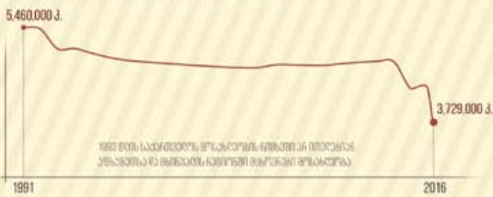
მოსახლეობის ოფიციალური დინამიკა

მოსახლეობის უარყოფითი დინამიკა აიხსნება შრომითი თუ სხვა ტიპის მიგრაციით, რაც თავის მხრივ გამოწვეული იქნა რთული სოციალური თუ პოლიტიკური გარემოთი