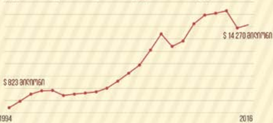
ქვეყნის მთლიანი შიდა პროდუქტი (ერთ სულ მოსახლეზე)