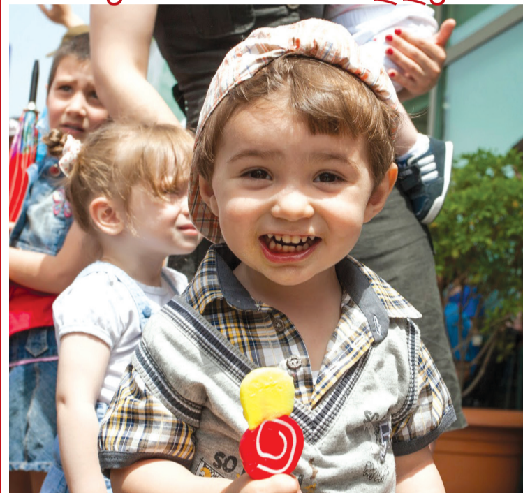
დღეს დედამიწა ბავშვის ღიმილში გახვეულა და სივრცეში მიჰქრის.