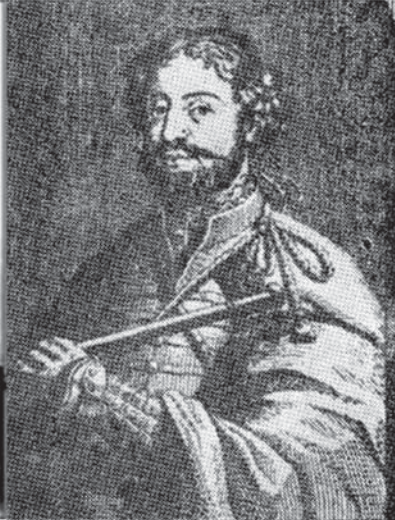
კახეთის უფლისწული ერეკლე, რუსეთში ცნობილი ნიკოლაი დავიდოვიჩის სახელით, შემდგომში კახეთის მეფე ერეკლე I, გამუსულმანების შემდეგ ეწოდა ნაზარ ალიხანი

გვამცნობენ: პეტრე დიდის მამა აღექსი მიხეილის ძე რომანოვი, საკმაოდ განათლებული და კულტურული პიროვნება იყო. ბუნებით კეთილი და ლმობიერი, მტრებს, მემამბოხეებს და დამნაშავეებს მკაცრად უსწორდებოდა. დიდი ოჯახის მამა (ჰყავდა 14 შვილი, 6 ვაჟი და 8 გოგო) სამეფო კარის წესის თანახმად მაინც განმარტოებულად ცხოვრობდა. სამეფო რეზიდენციის (კრემლის) ქალთა ნაწილში ასევე კარჩაკეტილი იყო დედოფალი. ასევე იზრდებოდნენ შვილები.