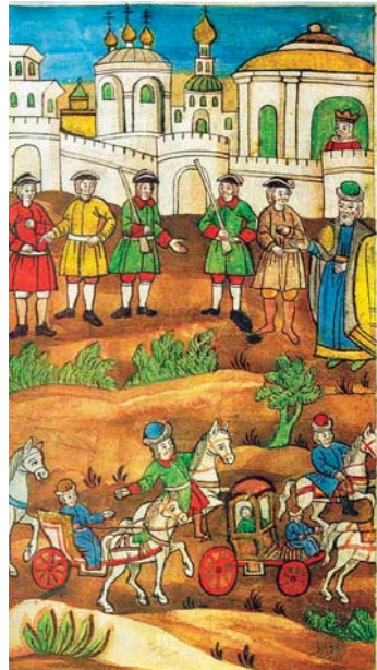
სოფია ალექსის ასულის 1689 წელს ნოვოდევიჩის მონასტერში გამოკეტვის ამსახველი მინიატურა

ძნელია მარჩიელობა, რა აზრები ანუხებდა ჭკვიან მეფეს, როცა 1650 წ., ელჩების (ნიკიფორე ტოლოჩანოვისა და ალექსი იევლევის) მეშვეობით, თეიმურაზ I შვილიშვილის ლუარსაბის ან ერეკლეს მოსკოვში გაშვება მოსთხოვა. ალექსი მეფემ კარგად იცოდა, რომ იმერეთში გადახვეწილ კახეთის მეფედ ყოფილ თეიმურაზ I, მძიმე წარსული და უიმედო მომავალი ჰქონდა. დედა და შვილები, სპარსეთის შაჰმა აბას I დაახოცინა. ქალიშვილი დარეჯანი, ჯერ ზურაბ არაგვის ერისთავს მიათხოვა (გიორგი სააკაძის რჩევით), შემდეგ იმავე დარეჯანის მეშვეობით სიძე ზურაბი მოაკვლევინა და დაქვრივებული იმერეთის მეფე ალექსანდრეს მიათხოვა. ვაჟი დავით ქართლისათვის ბრძოლას შეეწირა. თავად თეიმურაზი შვილიშვილებით (ლუარსაბი, ერეკლე, ქეთევანი) იმერეთში აფარებდა თავს. სწორედ აქ მოსთხოვეს რუსეთის ელჩებმა ერთი შვილიშვილის მოსკოვში მივლინება. ბოლოს თეიმურაზ I დათანხმდა უმცროსის, ერეკლეს, გამგზავრებას. ერეკლეს თან გაჰყვა დედა, ელენე ლევანის ასული და ასამდე ქართველი საერო და სასულიერო პირი. ამის შემდეგ მოსკოვში ერეკლე ხდება ნიკოლაი დავიდოვიჩი, ხოლო ელენე, – ელენა ლეონტიევნა. ასეთია რუსეთში მათი ცხოვრების თავისებურება. (ბატონ ვახტანგ ტატიშვილს აქვს სპეციალური კვლევა ჩატარებული ამავე საკითხებთან დაკავშირებით