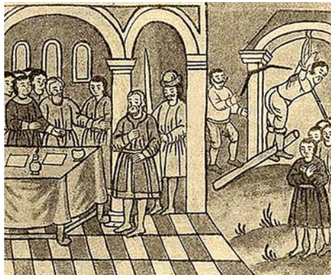
თევდორე შაკლოვიტის დაკითხვა და წამება, მინიატურა.

ასე იყო თუ ისე, შუალამისას პეტრე გააღვიძეს, აუხსნეს სიტუაცია და საცვ-