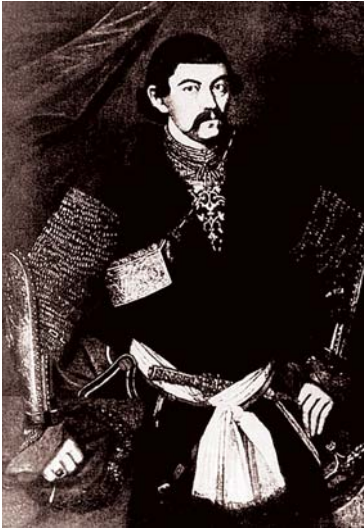
ბატონიშვილი ალექსანდრე არჩილის ძე ბაგრატიონი – პეტრეს სიყრმის მეგობარი. რუსეთის პირველი ფელდცეხმაისტერი.

რის“, კირილე ნარიშკინის 18 წლის ასული ნატალია. მეფის ყურადღება მიიპყრო იმდენად არა გოგონას თავისუფალმა, ტემპერამენტთანმა ქცევამ, რამდენადაც გარეგნობამ. მართალია ზოგი ცნობით ნარიშკინები ჩეხური წარმომავლობისანი არიან, მაგრამ უფრო მართებული უნდა იყოს მათი თათრული ფესვებიდან მომდინარეობა. ნატალია კირილეს ასული ლამაზი შავგვრემანი ქალიშვილი გახლდათ. ალექსი მეფის პირველი ცოლი თუ ქერთამიანი იყო, თავადაც დაბალი, მსუქანი, ბალნიანი და სახელაჟლაჟა, რა გასაკვირია, რომ შვილებიც ამდაგვარები გამოვიდნენ. ნატალია კი შავგვრემანია, ისევე, როგორც მისი აღზრდილი ივერიელთა უფლისწული.