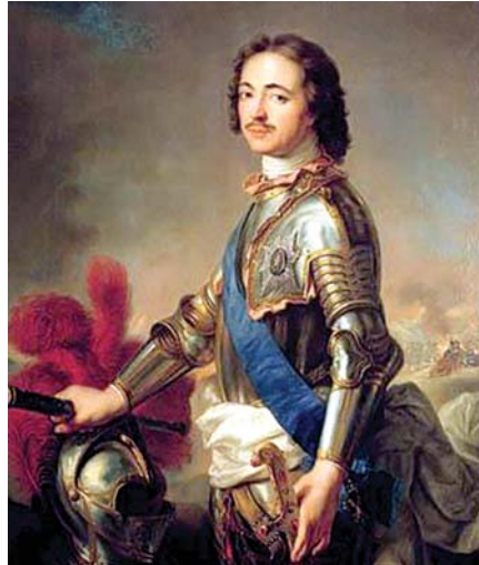
იმპერატორი პეტრე I

დაქვრივების მომენტი-სათვის ალექსი მეფეს ხუთი გოგო და ორი ბიჭი დარჩა. ისე მოხდა, რომ ორივენი გამხდარი, ავადმყოფური გარეგნობისანი იყვნენ. ამასთან უმცროსი, ივანე, ნახევრად ბრმა და ჭკუა სუსტი გამოდგა. ამბობენ, რომ 6 წლის ასაკში ლაპარაკიც უჭირდა.