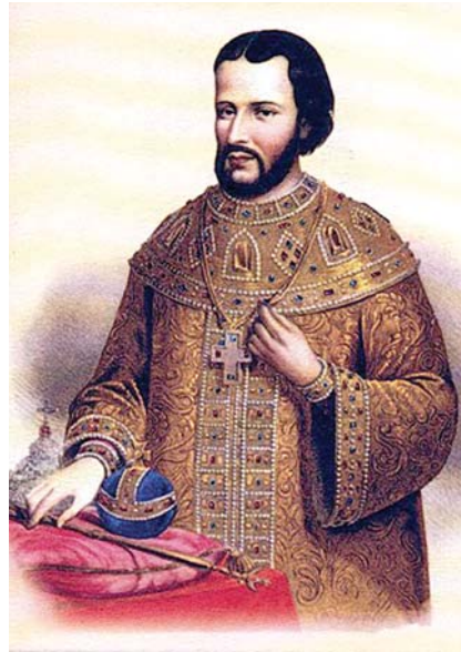
ივანე V ალექსის ძე – პეტრე I ნახევარძმა.

უფროსმა ძმამ ავადმყოფმა თევდორემ მონათლა. მოსკოვი ზეიმობდა და მოზეიმე მეფემ ეს პასუხსაგები მისია უფროს ვაჟს, მის უშუალო მემკვიდრეს დააკისრა. თევდორესთან ერთად ნათლია გახდა ალექსის და ირინა მიხეილის ასული, პატარას მამიდა. ნათლიობა თავად პატრიარქმა ჩაატარა ჩუდოვოს მონასტერში. პეტრე-პავლობის დღესასწაულზე პატარას პეტრე უწოდეს. მზრუნველებად ქალებისა და კაცების მთელი გუნდი განუმწესეს უმაღლესი არისტოკრატიული ოჯახებიდან.