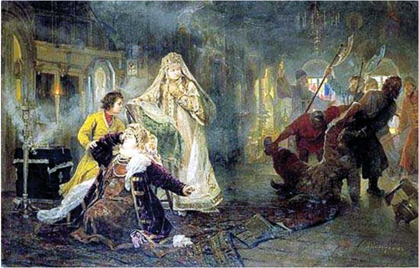
1682 წლის სტრელცების აჯანყება, მხატვარი ა. კორზუხინი (1882 წ)

მაგრამ თევდორე მეფემ ხასიათი გამოაჩინა. ჟამთა ამწერნი ამბობენ, რომ თევდორე უმცროს ძმასა და საკუთარ ნათლულს, პეტრეს მფარველობდა, ხოლო ნატალია დედოფალს სიმპატიით ექცეოდა. ამიტომ ისინი რეპრესიებს გადაურჩნენ. უფრო მეტი, თევდორე მეფემ მოითხოვა, რომ პეტრესათვის წერა-კითხვა ესწავლებინათ ლოცვასთან ერთად. დიაკი ნიკიტა ზოტოვი მიუჩინეს მასწავლებლად.