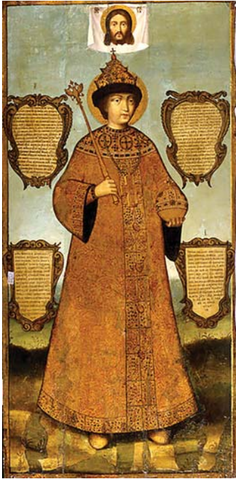
პეტრე I ნახევარძმა – მეფე თევდორე III ალექსის ძე

იმართებოდა. ინგლისიდან, კრომველის დროს, სისხლიან გარჩევებს ბევრი გამოექცა. მათ შორის ჰამილტონები, ლესლი, გორდონი და სხვა. იმ დროს, კრემლთან ახლოს მდ. იაუზის ნაპირას (ახლა ეს მდინარე ბეტონითაა გადახურული) იყო გერმანელების დასახლება. უცხო-ტომელები იქ ერთად იყვნენ და პატარა ევროპას ქმნიდნენ. შოტლანდიელი, ინგლისელი, ჰოლანდიელი, შვეიცარიელი, გერმანელი არისტოკრატები რუსების გაკვირვებასა და პატივისცემას იმსახურებდნენ თავისი ცოდნის, პატიოსნების, მონესრიგებულობის გამო. ისინი ევროპიდან იწერდნენ წიგნებს, გაზეთებს და იყვნენ მსოფლიო მოვლენების კურსში. მოღვაწეობდნენ როგორც ექიმები, ფარმაცევტები, მასწავლებლები, ინჟინერ-ხელოსნები, ვაჭრები. ჰქონდათ თეატრი, იკრიბებოდნენ იოჰან მონსის ღვინის სავაჭროში, დროს ატარებდნენ, თათბირობდნენ. ჰქონდათ კათოლიკური ეკლესია.