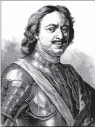
რუსეთის რეფორმატორი იმპერატორი პეტრე პირველი