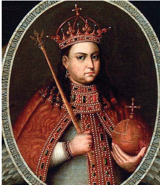
პეტრე I ნახევარდა, რუსეთის მმართველი რეგენტი პეტრეს სრულწლოვანებამდე – სოფია ალექსის ასული

ალექსი მეფე ხელს უწყობდა ევროპელების რუსეთში ჩასახლებას და თავადაც ზოგჯერ სტუმრობდა არტამონ მატვეევს. არტამონს ცოლის გავლენით სახლი და სახლეულობა ევროპულ ყაიდაზე ჰქონდა მოწყობილი და ჩაცმული. ჰქონდა საკუთარი ბიბლიოთეკა, ქიმიის ლაბორატორია და პატარა საოჯახო თეატრი. მეფე არტამონის გარემოში ისვენებდა.