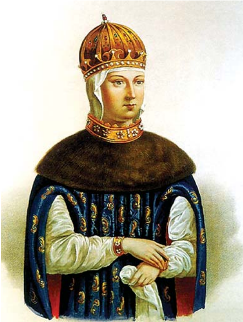
დედოფალი მარია მილოსლავსკაია (მეფე ალექსი მიხეილის ძის პირველი ცოლი)

და საერთო ძალით ხელყოფდნენ რუსეთის წინსვლას. რუსეთი მტრებისაგან ჩაკეტილი, საერთო ცივილიზაციას მოწყვეტილი ქვეყანა გახლდათ. მონღოლურ-თათრული დანატოვარი, თუნდაც გადარუსებული, ვრცელ და ხალხმრავალ სახელმწიფოს აღარ აკმაყოფილებდა.