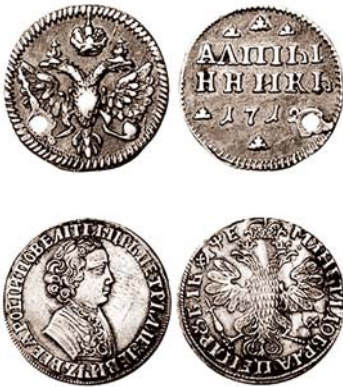
პეტრე I მოჭრილი მონეტები

თავად ალექსი მეფეს, 14 შვილის მამას, ორმოც წელს გადაცილებულ, ავადმყოფობით შეწუხებულ მამაკაცს, 1667 წ. მოუყვდა შვილების დედა, დედოფალი მარია მილოსკავსკაია. იმ დროს, გარუსებული პოლონელი მილოსლავსკები,