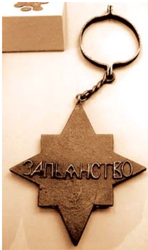
პეტრე I მიერ დანესებული მედალი ლოთობისათვის. ამ მედალის კავალური ვალდებული იყო მთელი კვირა ეტარებინა ეს თუჯის მედალი, რმელიც 6,8 კგ-ს იწონიდა.

29. 06. 1688 წ. პეტრე მეფის ნათლობის დღეობა იყო. ქეიფის დროს პეტრე საკუთარი ხელით უმასპინძლდებოდა ქართველ ნათესავებს; ეხუმრებოდა და ეფერებოდა. მეორე დღეს კი ქართველები იმერეთისკენ გაემგზავრნენ.