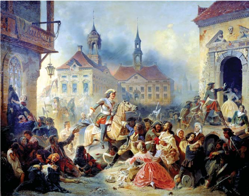
1704 წ. პეტრე I ნარვისთვის ბრძოლაში

იმ დროს კახეთში მეფობდნენ არჩილ ვახტანგის ძე და ერეკლეს და, თურქების ტყვეობიდან თავდახსნილი ქეთევანი. ერ-