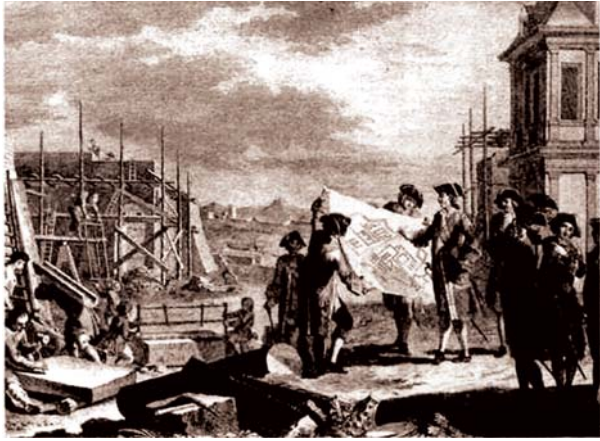
1703 წ. პეტერბურგის დაარსება

ვერ გაბედეს. მალე პეტრეს მიუვიდნენ მომხრე ძალები. სოფიამ მოინდომა ძმასთან, უკვე როგორც ძმასთან, შერიგება, მაგრამ უშედეგოდ. ბოლოს იძულებული გახდა ნოვოდევჩიეს მონასტერში აღკვეცილიყო.