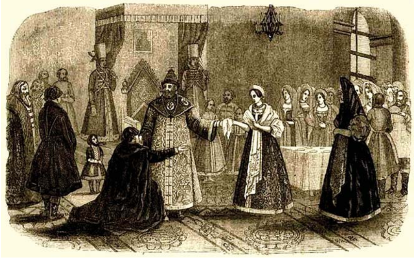
მეფე ალექსი მიხეილის ძე ცოლად ირჩევს ნატალია ნარიშკინას. ელვალე, გრავიურა, 1840 წელი.

ემსახურებოდა, ფეხსაცმელი ბრილიანტებით შემკული ჰქონდა, მიირთმევდა უნგრეთიდან მისთვის ჩამოტანილ ღვინოს. არ იკლებდა ამქვეყნიურ სიამოვნებას, რათა უკეთ ელოცა იმქვეყნად გასტუმრებულთა სულებისათვის.