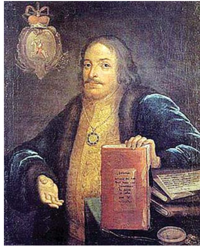
ვასილ ვასილისძე გოლიცინი

ეკლე I ჩავიდა კახეთში, იქიდან დასთან და სიძესთან შეთანხმებით სპარსეთში, მეფობის მოსაპოვებლად. ესეც ბედის ირონიაა. კახელი ერეკლე, რუსეთში ნიკოლაი დავიდოვიჩი და სპარსეთში ნაზარ-ალი ხანი ხდება. ჭეშმარიტად ძალა აღმართს ხანვს. არის ცნობა, რომ მას დედოფალმა ნატალია კირილეს ასულმაც გაუგზავნა წერილები და ბოლოს სასიკვდილოდ დაავადებულმა ალექსი მეფემაც სთხოვა შერიგება. შერიგება ვერ მოხერხდა. 29.01.1676 წ. მეფე ალექსი მიხეილის ძე რომანოვი გარდაიცვალა. დარჩა 14