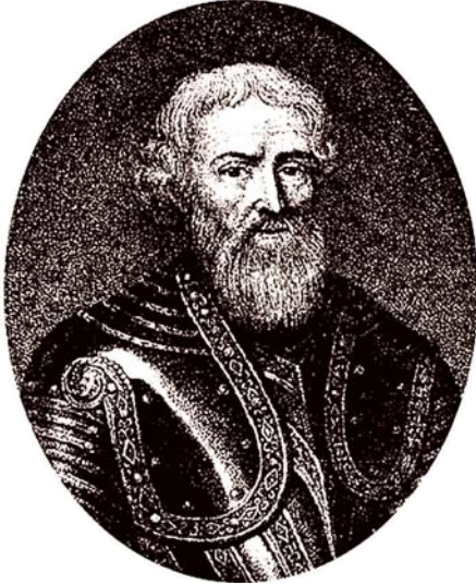
ბოიარი არტამონ მატვეევი

სათვის ცნობილი, კახეთის მეფე ერეკლე I). ზრდა-დასრულებული, ტანმა-ღალი, ლამაზი და ჭკვიანი ივერიელი უფლისწული ალექსი მეფის უახლოეს პიროვნებად ითვლებოდა. ნებისმიერი თავყრილობის დროს მეფის ერთ მხარეს პატრიარქი უნდა მჯდარიყო, მეორე მხარეს „ნიკო-ლაი დავიდოვიჩი“. იგი გაუძღვა წინ ქორწილიდან დასასვენებლად წასულ ნეფე-პატარძალს. მეფის ბრძანებით, მას ერთად-ერთს ჰქონდა დედოფლის „მოსანახულებლად“