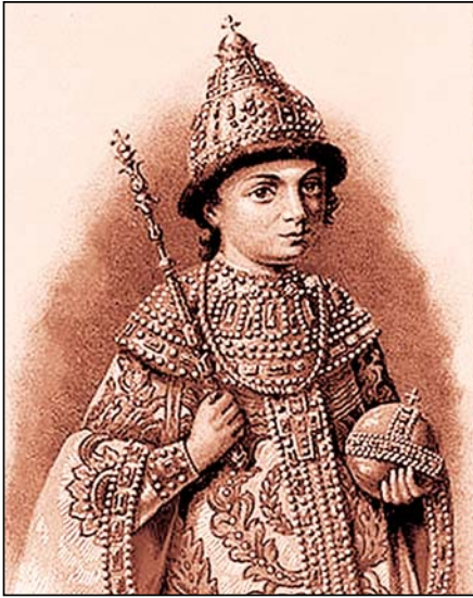
უფლისწული პეტრე რომანოვი

მხოლოდ მამათქვენი, დიდი ალექსი მიხეილისძე შედიოდა და დაუკითხავად და „ტისიაცკი“.