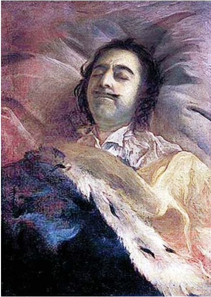
1725 წ. 8 თებერვალი. დიდი იმპერატორის აღსასრული

ბიდან დახსნილი ძმა, გზაში მოუკვდა პეტრეს.