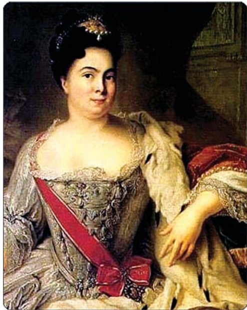
პეტრე I ფავორიტი ანა მონსი

როდესაც დედოფალ ნატალიასათვის ცნობილი გახდა მეფე ივანეს ცოლის ორსულობის საკითხი, მომხრეებმა გადაწყვიტეს დაესწროთ