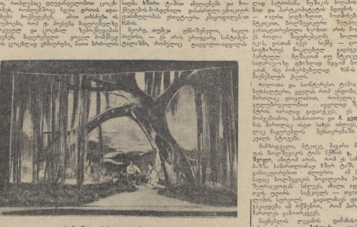
I მოქმედ. პირველი სურათი