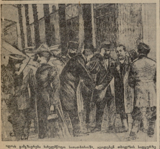
ილია ჭავჭავაძის სახელმწიფო სათაბიროში, აცხადებენ თბილისის სადგურზე