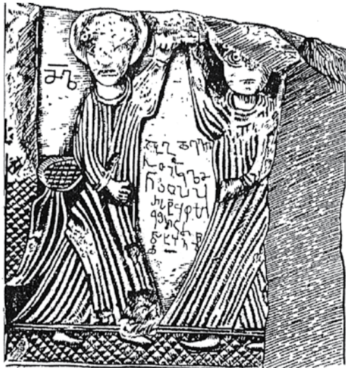
დავათის სტელა (ძ.ვ.წ. 680 წ.)

ზემოთქმული ცნობიერებაა ასახული საქართველოში მოძიებულ დავათის სტელაზეც, რომელიც აღმოჩენილია დუშეთის რაიონის სოფ. დავათის ხვთისმშობლის ეკლესიაში, რომელსაც