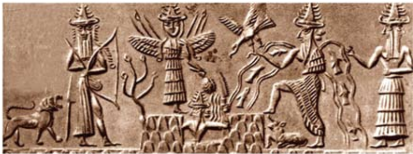
შუშარი (ძვ. წ. 3400 წ.)

ქართველთა ხვთისშვილები, რომლებიც არიან ნახევარღმერთები, ნახევარშხეები, ბერები, ბედის ბედაურის მფლობელები, მუდმივად არიან დევებთან და ქაჯებთან მებრძოლეები და ყოველთვის იმარჯვებენ მათზე. ხვთისშვილმა კოპალამ ქაჯებთან ბრძოლაში ლომი მოიპოვა, რომელიც ქაჯთა ძალი ეგონა, ბუქნა ბაადურმა – ხარი, თერგვაულმა – თეთრი მთის ქორი, ხოლო ქართველთა მითებით ბოლო 64-ე ხვთისშვილმა იახსარმა თავისი დობილი – სამძივარი მოიპოვა. აქაც, ხვთისშვილი იახსარი, რომელიც არის მამაღმერთის ერთ-ერთი სახე, ქაჯებისგან ათავისუფლებს თავის დობილს – ქალს და ამ ორი ნახევარშხის შეერთება ქმნის გამთლიანებულ შხეს, ანუ ოქროს საწმისის – ცეცხლის სტიქიის ენერგიას. ქართულ მითოლოგიაში შხე ქალია – ქალღმერთია. ეს კოსმიური პროცესი გენეტიკურ დონეზე აისახება ყოველ მიკრო და მაკრო სამყაროზე.