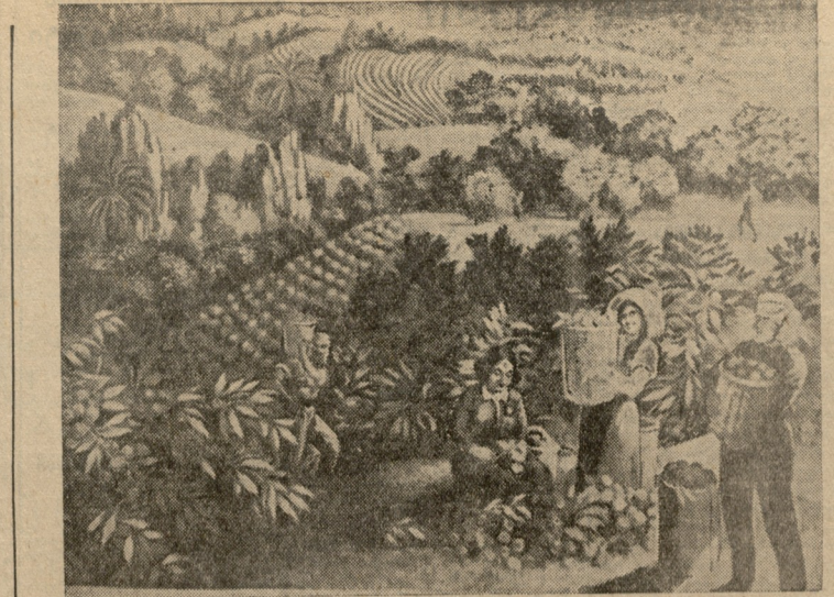
მანდარინის საბავთა მუშა ნიმუხი ნახ. ა. ვეხვაძის