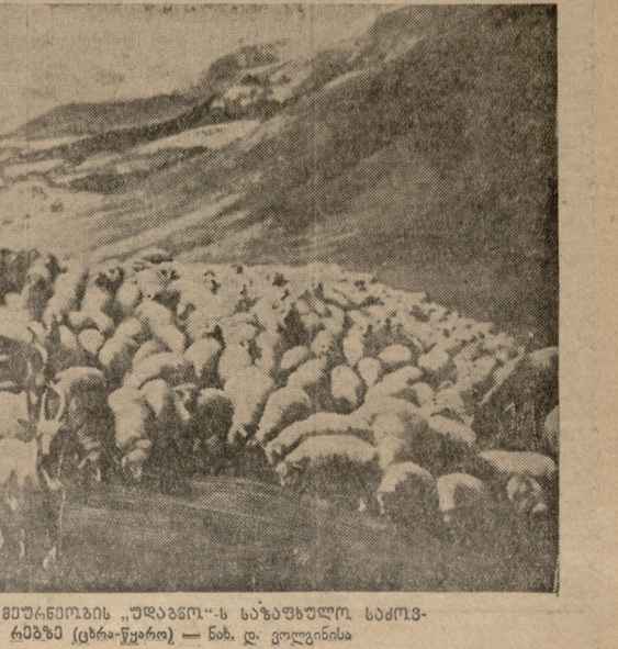
საბავთა მუშა ნიმუხი „შაბანო“-ს საბავთლო სარეზ-რამაში (ტრაქტორი) — ნახ. დ. კოლინისა

პირდაპირ გოგოლისებური ცრემლ-მარევი სიცილით არის გამსჭვ-