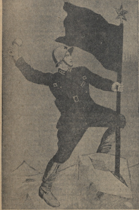
სიღმის ხასიათის გვირგვინი — ნაჭრის, შესრულებული წითელი არმიის 26 წლის მეთაურის ცოცხალი პორტრეტი.