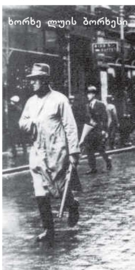
ხორხე ლუის ბორხესი

იმ 1922 წლის შემოდგომაზე თავშესაფარი გენერალ ბერკლის ვილაში ვპოვე. ვილის მეპატრონეს (მე იგი არასდროს მინახავს) იმჟამად ბენგალიაში რომელიღაც ადმინისტრაციული პოსტი ეჭირა. სახლს ჯერ კიდევ არ შესრულებოდა საუკუნე, მაგრამ უკვე გაცვეთილი და გავერანებული, უსარგებლო დერეფნებითა და არაფისთვის საჭირო ჰოლებით იყო სავსე. მთელი პირველი სართული ეკავა მუზეუმსა და უზარმაზარ ბიბლიოთეკას: მოჩმახული, ურთიერსაწინააღმდეგო ნივთები, რალაცნაირად, მე-19 საუკუნის ისტორიას წარმოადგენდა. ნიშაპურის ნახევარწრედ გაქვავებულ იატაკანებში თითქოსდა ბრძოლის გრიგალი და იერიში იმალებოდა. ჩვენ (როგორც მახსოვს) ფარული შესასვლელით შევედით. მუნმა ათრთოლებული, გამშრალი ტურები ჩაილულღულა, რომ ღამეული თავგადასავალი ძალზე საინტერესო იყო. ჭრილობა გადავუხვიე. ფინჯანი ჩაი მივანოდე. დავერწმუნდი, ჭრილობა კი არა, ნაკანრი ჰქონდა. მან უეცრად განცვიფრებით ჩაიბუტბუტა: