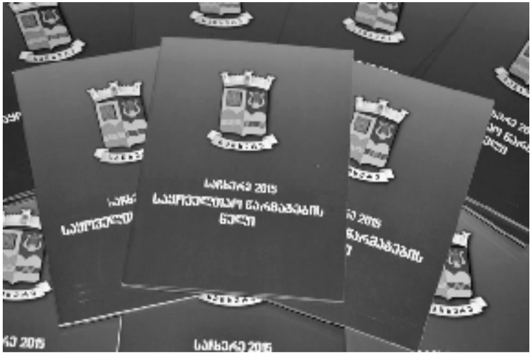
„საჩხერა 2015 - საყოველთაო წარმატების წელი“