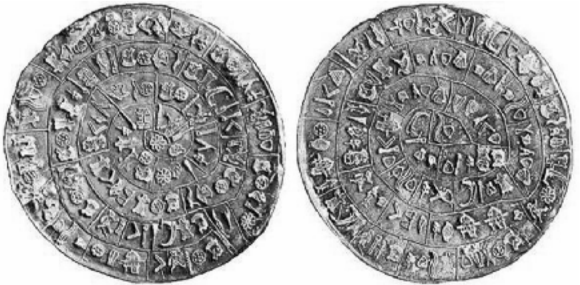
ფესტოსის დისკოს A და B მხარეები

1908 წლიდან, მას შემდეგ, რაც კუნძულ კრეტაზე, ქალაქ ფესტოში არქეოლოგმა ლუიჯი პერნიემ თიხის დისკო აღმოაჩინა, მსოფლიოს სხვადასხვა ქვეყნის მეცნიერმა, მსოფლიოს 36 ენაზე სცადეს მისი ამოკითხვა, მაგრამ ამოდ. მეცნიერთაგან მხოლოდ ერთი, ავსტრიელი მკვლევარი წარმოთქვა მისი პიპოთეზა, რომ შესაძლებელი იყო დისკო ღმერთების ენაზე, იბერიულად ფოფილიყო დაწერილი