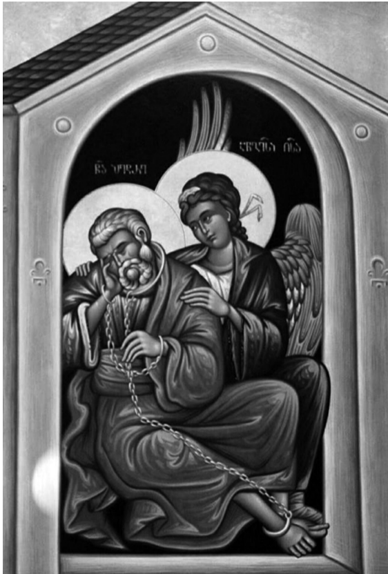
სატი - პეტრე მოციქულის ჯაჭვი