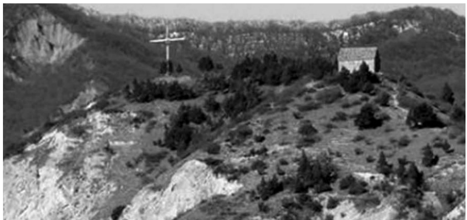
სატი - პეტრე მოციქულის ჯაჭვის ეკლესია

წყალობითა ღვთისითა, მეფემან თეიმურაზ ძემ ჩვენმან მეფემან ერეკლემ ესე წიგნი და სიგელი გიბოძეთ შენ ჩვენსა ერთგულსა და თავდადებით ნამსახურსა ლო-