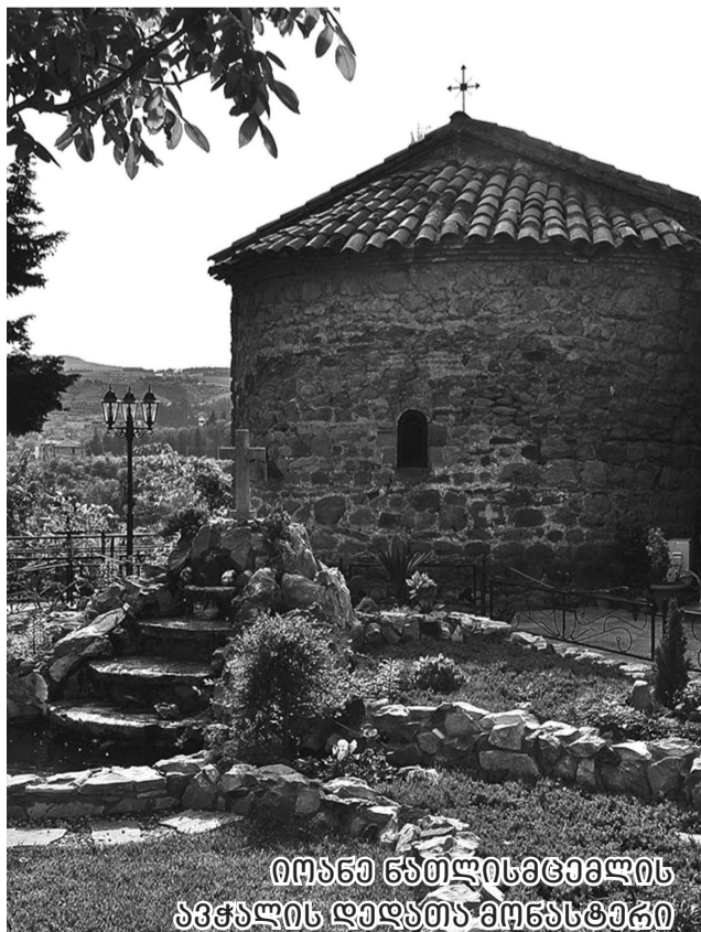
იოანე ნათლისმცემლის ავჭალის დედათა მძინარე

ჩვენი გაზეთის მკითხველს წინა ნომერში დავპირდით, რომ დანვრილებით ინფორმაციას იხილავდნენ ავჭალში არსებული პეტრე მოციქულის ჯაჭვის თაყვანისცემის სახელზე აშენებული ეკლესიის შესახებ, რომელიც საქართველოში ერთადერთია. ავჭალა მდებარეობს თბილისის ჩრდილო-დასავლეთით. მისი დასავლეთი მხარე ესაზღვრება მცხეთას და სოფ. წინამურს – მტკვრისა და არაგვის შესართავთან. ავჭალა შექმნილია მტკვრის კალაპოტზე, რომელიც გაშლილი იყო ავჭალის მთების ძირამდის, ხოლო მარჯვენა სანაპირო ახლანდელი დიდი დიღმის მთებამდის. დროთა განმავლობაში, (როგორც მდინარეს ახასიათებს), შეიცვალა კალაპოტი, ხოლო მდინარის წყლით განაყოფიერებულ ადგილზე წარმოიქმნა უდაბური ტყე, რომელსაც ხალხმა ავიჭალა უწოდა. ავჭალის სახელი საკმაოდ ხშირად გვხვდება ქართულ საისტორიო წყაროებსა და სიგელგურჯებში.