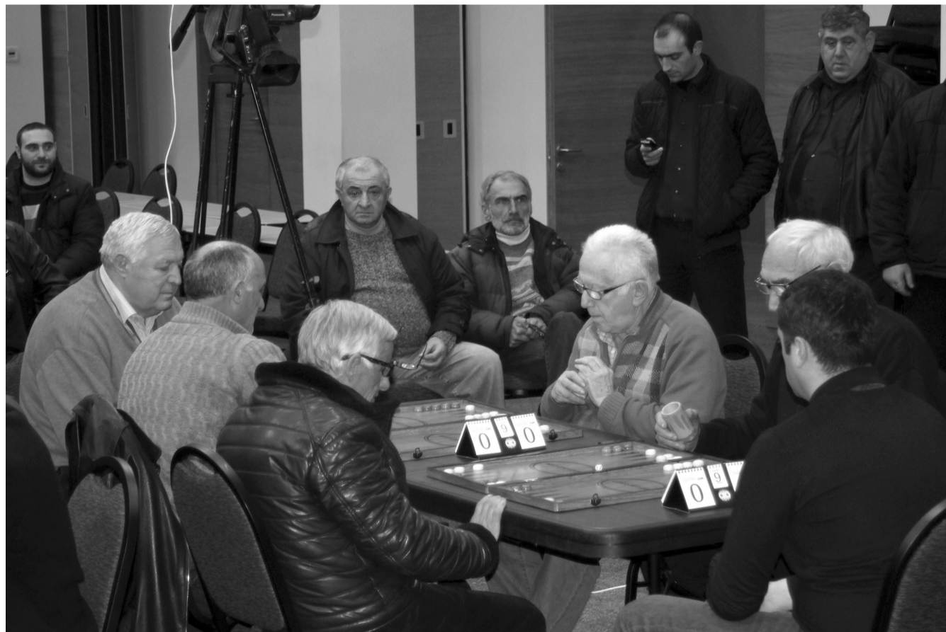
2016 წლის 23 იანვარს, „ექსპო-ჯორჯიას“ მესამე პავილიონში გაიხსნა საქართველოს ჩემპიონატი ნარდში.

ამასთან უნდა გვახსოვდეს, რომ ყოველგვარი ამგვარი ჩვეულება თავისებურ ხალხურ ინტერპრეტაციას იღებს და პირვანდელი ფორმით არ აღწევს ჩვენამდე, მიუხედავად იმისა, რომ სულიერი კულტურა თავისთავად მდგრადი და კონსერვატიულია. ამგვარი მსჯელობის საფუძველს სვანური მასალა გვაძლევს. სვანურში აღნიშნულ ჩვეულებას „ლაშურალ“ ჰქვია, რაც სიტყვა-სიტყვით სულის ახსნას ნიშნავს „ლაშ“ სულია, „რალ“ ახსნა, სხვათა შორის „შურ“ – მეგრულშიც სულია. იქნებ „ხელების“ გადაშლით – „ხელის ახსნით“, სწორედ სულის განთავისუფლება იგულისხმება. ეს შესაძლოა იმ გაგებითაც იყოს გამართლებულია, რომ ამიერიდან აქამდე „შემოჭრილ“, „გულხელდაკრეფილ“ ანუ „ხელებდაჭდობილ“ მიცვალებულს ჭამა არ შეეძლო, ხელის გაშლის შემდეგ კი, როცა იგი თავისუფლდება, სული ამოსდის, ამის საშუალება ეძლევა. სიმბოლური გადააზრებით იწყება სულის კვება. ასე რომ ჩვენი აზრით ეს უნდა იყოს სულის ახსნის იგივე ხელის ახსნის რიტუალი თუმცა უნდა ითქვას, რომ პურობის სამწუხარო რეჟიმი ამით არ მთავრდება და მას სხვა ხარჯები მოსდევს. ამ ხარჯებიდან ზოგიერთ კუთხეში ორმოცამდე აღნიშნავენ თხუთმეტის რიგს (ხევი – დ. გიორგაძე, იმერეთი – ოკრიბა, გ. გოცირიძე), მაგრამ სამწუხაროდ ამ წესის ახსნა მასალის სიმცირის გამო ჯერჯერობით ვერ შევძელით.