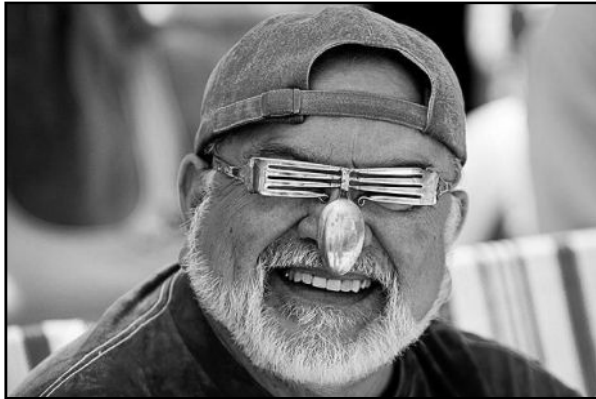
იუმორი გენიალობის ერთ-ერთი ელემენტია

კიდევ ერთი მეტად საჩოთირო და სათუთი საკითხი იუმორის შემქმნისას, მეცნიერული ენით რომ ვთქვათ, ჰიპერბოლიზაციაა, ანუ ჩვენებურად — გაზვიადება, ამა თუ იმ ნიშან-თვისების მეტისმეტ „სიმაღლებზე“ აყვანა. იუმორის ამ პარამეტრში ყველაზე უკეთ ჩანს მისი მიზნურობის თუ მთქმელის გემოვნება; ვთქვათ, ყველა-სათვის ცნობილია, რომ ქალზე ბევრი ლაპარაკი უყვართ, მაგრამ რადიოსთან მისი შედარება დღეს უკვე აღარც იუმორია და აღარც სინამდვილე, რადგან XXI საუკუნის რადიო თითქმის აღარ ლაპარაკობს - ან გაუთავებელ მუსიკას ატრიალებს, ან სარეკლამო რგოლებით („როლიკებით“) ატკობს ჩვენს სმენას. საერთოდ კი XXI საუკუნის რადიო მთლიანად უკვე „კომიკურ