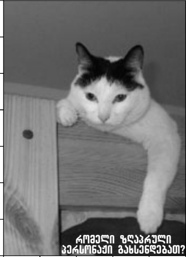
როგორი ზღაპრული პერსონაჟი გასწავლავთ?