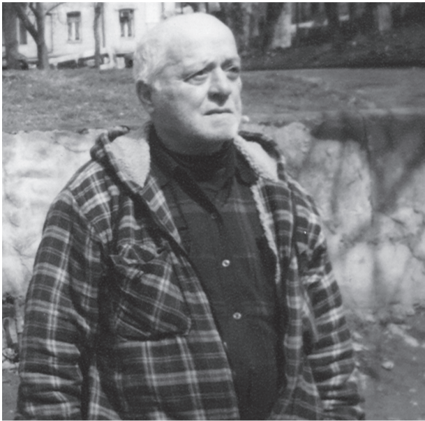
ვუძღვნი ქართველ ბავშვებს, ბავშვებო, მე თქვენ საკუთარ სიცოცხლეზე მეტად მიყვარხართ - ავტორი

ყმანვილო ბიდან, არა უფრო ადრე... ჩემმა დიდმა მოძღვარმა ქართველი ერის ბედი ისე ნათლად დამიხატა, ისე ბრწყინვალედ დამიხატა, რომე გარკვეულად დავინახე სივრცეში გადმოკიდებული ორპინიანი სასწორი; დიდი, უზარმაზარი პინებით.