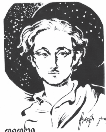
თეფრია ბაღის ანგელოზი