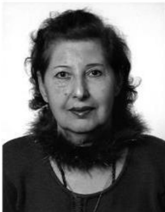
კოლხურ კოშკში ფორთაქობს მშობელი, სიტყვის ოსტატს პრეზიდენტი ეახლა, სიყრმიდანვე მოხსტრთან შერკინებული,

სამშობლო რომ თავისუფლად ენახა, მონაპოვარს ვევა-ფორანი ესევა... ეაყაყო სისხლი ფსოუს საზღვარს გასდევს, აფხაზეთის გზას მიჰყვები ტანჯული, მხრებზე ქრისტეს მძიმე ჯვარი გადევს... კვალში გიდვას პაროტება... ვესროლეს... არ გაღირსეს მშობლიური მიწანი, დედოზარი შემოკარაით ქართულენო, მერამდენედ იმარება წმინდანი... ...წილნაყარი გახდი უკედავებისა, ანგელოსნი ვიგალობენ, მღერიან, ქართულის დედა გეგებება ამაყად, მიაწმინდაზე ღირსეულად გეუბებიან. ცალად დარჩა სასაფლაო ჯოპარის, მტრად ორივეს რუსი გვადათ ვერაგი, მზობის წმინდა დღეს გოლოცავს მწუხარე, თოთხმეტი წლის მომლოდინე მერაბი, ნათელი გზა, მცხეთისაკენ მაკალი, მიცხოვარმა გიყურთხა და გაჩვენა, სანიღებს ვინთებს სვეტიცხოვლის ტაძარში, არსაკიდის მოკეილი მარჯვენა, დაცხრილული მოგეკება ილია, ნათელში დგას, საღლა არის წვედადი,