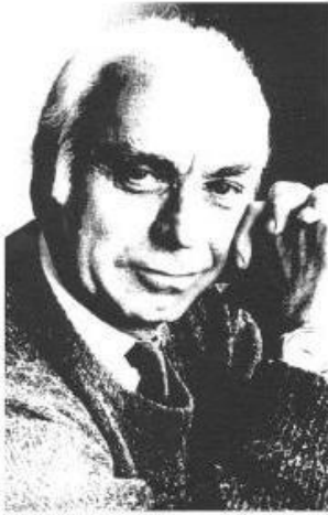
თუ სისხლმა არაა იყიდა, თუ გული არ ჩაერია

სწავლის და ცოდნის ძიებას, გაგებარია ფიცი აქვს, რომ მოიარო ვეროპა, ამერიკა და აზია.