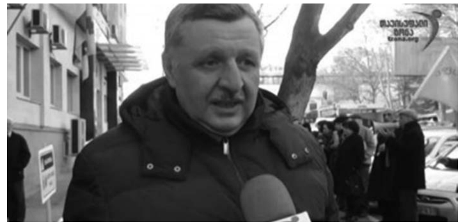
აფხაზეთის ავტონომიური რესპუბლიკის კონსტიტუციაში ცვლილებების საჯარო განხილვა პოლიტიკური სპეკულაციისა და საზოგადოების თვალში ნაცრის შეყრის მორიგ მცდელობად იქცა.

სალ აზრს მოკლებულმა ე.წ. აფხაზთა კრებამ(პატარაია, კვარაცხელია...) ამჯერადაც უკუღმართად გაიგო კონსტიტუციაში ცვლილებების გამოწვევი მიზეზები ან სულაც არ გაცნობია მათ, მაგრამ ჭიქაში ქარიშხალი შექმნა - აქაო და „აფხაზეთის ხელისუფლება პოლიტიკურ და სამართლებრივ თავისუფლებას აცხადებსო!“ (სახელმწიფო დამოუკიდებლობას?!) ასეთი, უარგუმენტო დასკვნის გაკეთება რაღაც მიზანს უნდა ემსახურებოდეს. მათივე „ნააზრებიდან“, ჯერჯერობით, აშკარად მხოლოდ აფხაზეთის უმაღლესი საბჭოს ახალი არჩევნების ჩატარების მოთხოვნა გამოჩნდა (!) დავიჯეროთ, მართლა არ იციან, რომ მდ.ენგურს გამოღმა კი არ არის აფხაზეთის ავტონომიური რესპუბლიკა, ის ენგურს გაღმა?