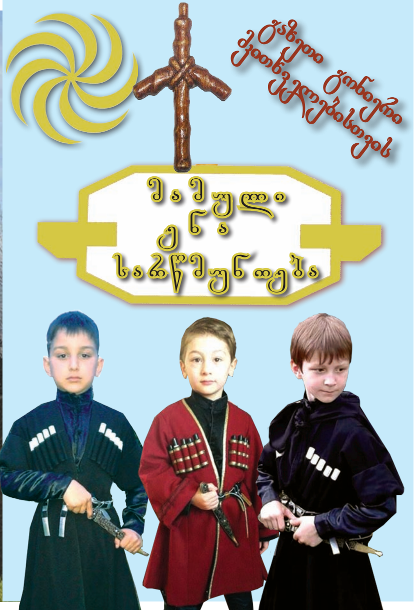
კვეტერა, XI ს.

განათავისუფლებელი ქართული ენის საზღვრეებს