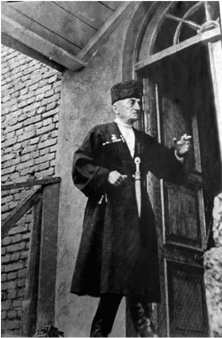
(15 მაისი კონსტანტინე გამსახურდიას დაბადების დღეა!)

„მე დავიბადე მსოფლიოს უმცირეს და უმოკლეს მდინარის პირას. მას ჰქვია სახელად ზანა.“