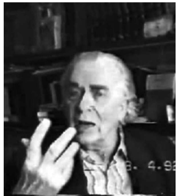
რული მიმართულების მეცნიერი