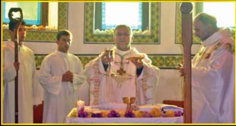
ახალშენის ეკლესიის დღესასწაული