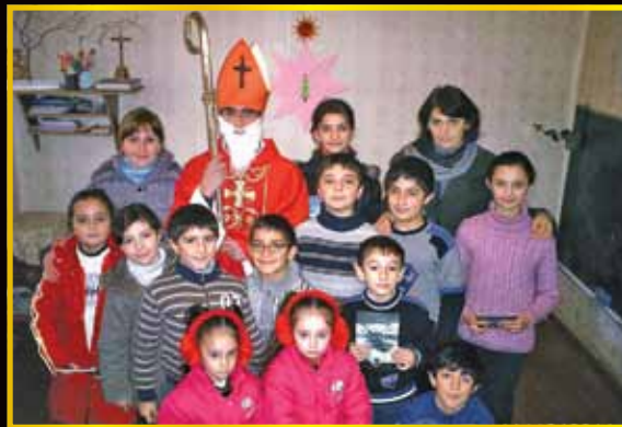
ნიკოლოზობა და საადვენტო დღეები ვალეში