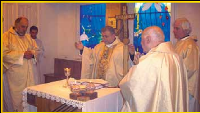
ქუთაისის ეკლესიის დღესასწაული