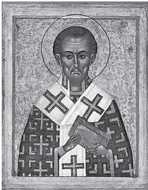
წმ. იოანე ოქროპირი

რედ პირველ ნოემბერს აღინიშნებოდა. კელტური ადათების მიხედვით, სამჰაინის დროს, მიცვალებულებს შეეძლოთ იმ ადგილებს დაბრუნებოდნენ, სადაც ისინი სიცოცხლეში დადიოდნენ, ყველა ზეიმი მათ პატივსაცემად იმართებოდა. სწორედ ამით აიხსნება ისტორიულად, თუ რატომ იხსენიებენ 2 ნოემბერს ყველა მორწმუნე მიცვალებულს. მოგვიანებით, პაპი გრიგოლ III (731-741) პირველ ნოემბერს წმიდა პეტრეს სამლოცველოში რელიკვიების – „წმიდა მოციქულთა და ყველა წმიდათა, მარტვილთა და აღმსარებელთა, და ყველა მართალთა, რომელნიც განისვენებენ წუთისოფლის სიმშვიდეში“, – კურთხევის აღმნიშვნელ თარიღად ირჩევს. ყოველთა წმიდათა დღე სიხარულის, იმედის, რწმენის დღესასწაულია. ეს ერთ-ერთი დახვეწილი და ინტელექტუალური დღეა მათ შორის, რასაც ქრისტიანული ლიტურგია გვთავაზობს; იგი მთელ კაცობრიობას ეკუთვნის, მეტადრე კაცობრიობის იმ ნაწილს, რომელიც ესავდა, განიცდიდა, სამართალს ეძებდა, რომელიც დამარცხებული ჩანს, მაგრამ სინამდვილეში ტრიუმფატორია. ყოველთა წმიდათა დღესასწაული მოიხსენიებს არა მხოლოდ იმ წმიდანებს, რომლებიც კალენდარშია აღნიშნული და რომლებსაც თაყვანს ვცემთ საკურთხეველზე, არამედ მათაც, რომლებმაც ისე ფეხაკრეფით განვლეს ამქვეყნიური ცხოვრება, რომ ვერავინ შეამჩნია, მაგრამ თავიანთი უთქმელი, წყნარი გულით ღვთისა და მოყვასის სიყვარულის დიდებული მონუმენტობა დაგვიტოვეს; შეიძლება ესენი იყვნენ ჩვენი ახლობლები, მეგობრები, მშობლები, თავმდაბალი ქმნილებები, რომლებმაც ისე უხმაუროდ, უანგაროდ თესეს სიკეთე, რომ ვერც კი შევამჩნიეთ. სადღაც წამიკითხავს, რომ ერთი სოფლის მოხუცი