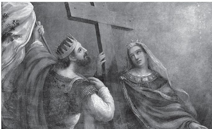
ელენე და კონსტანტინე

დიდძალი მელანი დაიხარჯა – ევსებიდან ჩვენს დღეებამდე – ამ ისტორიული ეპიზოდის აღსაწერად, რაც სინამდვილეში გაცილებით რთული გახლდათ, ვიდრე ეს ერთი შეხედვით ჩანს. აუცილებელია კონსტანტინეს ცხოვრების შესწავლა; ლეგენდიდან გამომდინარე, რაც მის შესახებ გავრცელდა, ხშირად გვიჭირს იმ ფაქტების ერთობლიობაში მოყვანა, რასაც იმდროინდელი ეპოქა ამოწმებს ჩვენთვის არცთუ კარგად ცნობილი იმპერატორის საომარ სტრატეგიაზე, და რაც ისტორიამ და მწირმა აგიოგრაფიულმა ცნობებმა შემოგვინახა. ისტორია არ მალავს კონსტანტინეს ფიგურის ყველაზე საშინელ ასპექტებს და მისი დედის, ელენეს – არაჩვეულებრივი იმპერატრიცასა და წმიდანის – აგიოგრაფიის წყალობით, ამ ფაქტებს ქრისტიანულ მონოდებას უთავსებს, რასთანაც ალბათ უპრიანია გარკვეული დისტანციის დაჭერა, მიუხედავად იმისა, რომ ევსები კესარიელის მიხედვით, სიკვდილის წუთებში კონსტანტინემ ნათლობაც კი ითხოვა. რამდენ რამეზე გვმართებს დაფიქრება! ე.წ. „კონსტანტინესეული გადატრიალების“ თანმდევი შედეგები