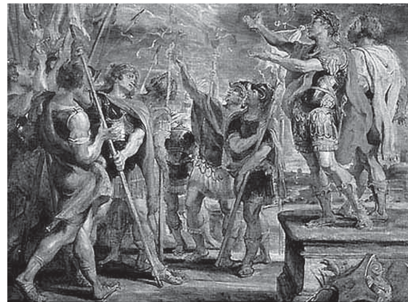
რუბენსი – კონსტანტინეს ხილვა

სასწაულებრივი მოვლენისა და სხვადასხვა, ურთიერთსაპირისპირო ვერსიების ფონზე, გარკვეული დასკვნები იკვეთება. ზოგმა ერთმანეთს შეუთავსა ევსებისა და ლაკტენციუსის ვერსიები და ამგვარად დაუდო სათავე ტრადიციულ ვერსიას, რომელიც ყველაზე მეტად არის