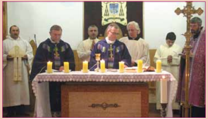
მთავარეპისკოპოსი მარეკ სოლჩინსკი კათედრალში