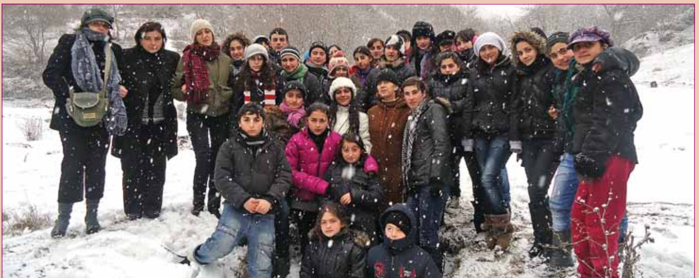
უდე – „იმედის“ ცენტრის ახალგაზრდები ბაკურიანში