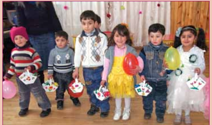
სიზაბავრა, დედის დღე