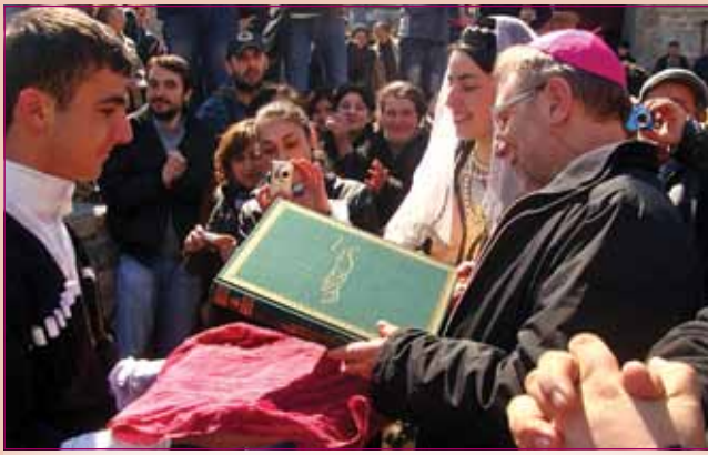
არალი, 19 მარტი