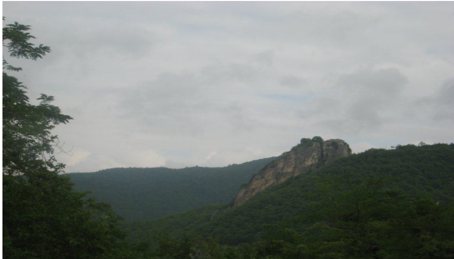
კვარა ციხეს ხედი კლდისუბანში

„ქართლის ცხოვრება“, ტომი IV, თბილისი, 1973 წ.). სულ ამ შრომაში გვარი იაშვილი ნახსენებია ცხრაჯერ, მათგან რამდენიმეჯერ როგორც სოფელ სადმელისა და ციხე კვარას მფლობელნი (იხ. „ქართლის ცხოვრება“, ტომი IV. გვერდები: 856, 860, 886, 864, 865, 869, 878, 885, 889).