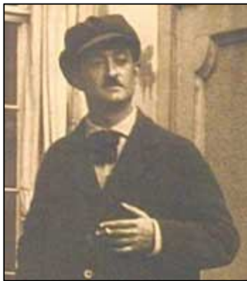
პოეტი პაოლო იაშვილი