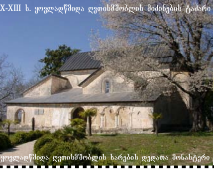
X-XIII ს. ყოვლადწმიდა ღვთისმშობლის მიძინების ტაძარი