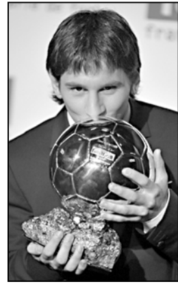
— 2010 წლის მსოფლიოს ჩემპიონატის კენჭისყრის შემდეგ უკვე ცნობილია. თქვენი აზრით, შეუძლია თუ არა არგენტინის ნაკრები შეინარჩუნოს ტიტული?

— არგენტინის ნაკრებს მშვიდად ყოფნა და ყოველ მომდევნო მატჩზე კონტროლს მართებს. ამისთვის საჭიროა, ნახავ-ნახავ ვიარო. ჩემი აზრით, ჩემპიონატიზე ფიქრს კონცენტრირება უნდა გავაკეთოთ, რომ ჩემთვის გამარჯვებულა იყოს სეზონი.