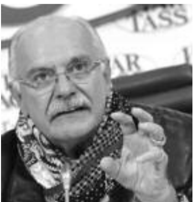
“ყველა სადად მოაზროვნე ადამიანისათვის სრულიად აშკარაა, რომ რუსეთი გეგმაზომიერად და მიზანდასახულად ნადგურდება. ხელისუფლების