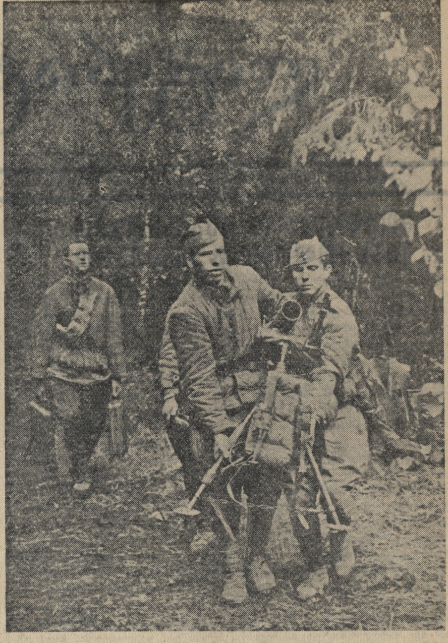
ლიტვინანტ კლემენტიანის ქვედანაყოფის ნაღვსმარცხენი მიწვევნი ახალ საბ-რთოლო პოზიციებზე.