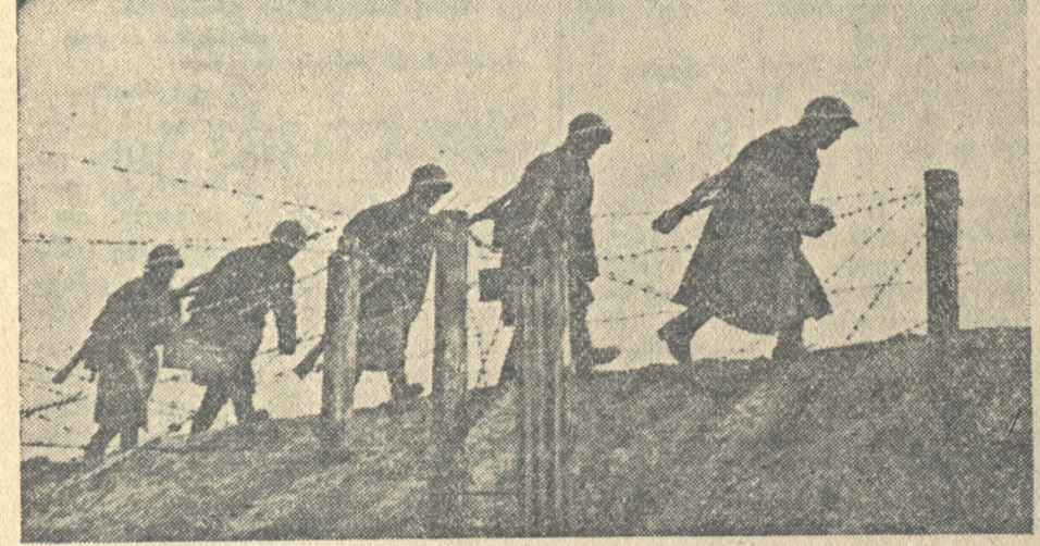
ლიტერატურის მისაღობების ერთ-ერთს უბანზე ჩვენნი გმირი მესანგრევი ამავ-რებენ პოზიციას.