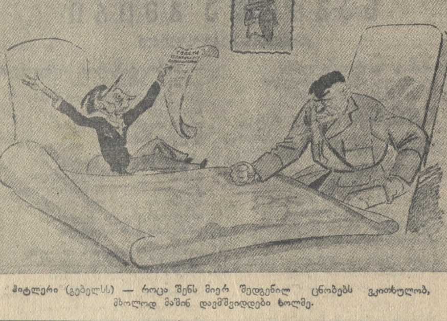
მეტრაჟი (გებელს) — როცა შენს მიერ შედგენილ ცნობებს ვითხოვ, მხოლოდ მაშინ დამეფიქსირებოდა...