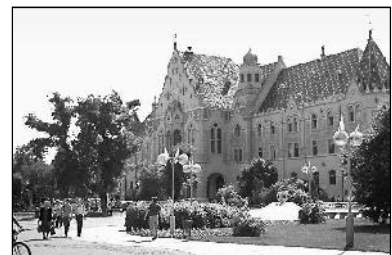
„ესტერჰაზის“ სასახლე მას „უნგრეთის ვერსალსაც“ უწოდებენ, რადგან აქ მუშაობდნენ ჰაიდნი, ლისტის და სხვა გამოჩენილი მუსიკოსები