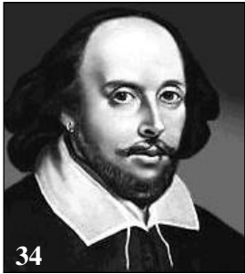
William Shakespeare (1564-1616) Sonnets