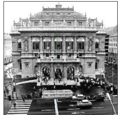
ორსერის შენობა ბუდაპეშტში