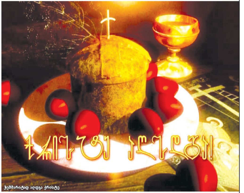
ჭეშმარიტად აღდგა ქრისტე

ყველაზე უწინ წამოდგა საოცრად ერთგული მარიამ მაგდალინელი. შეი-