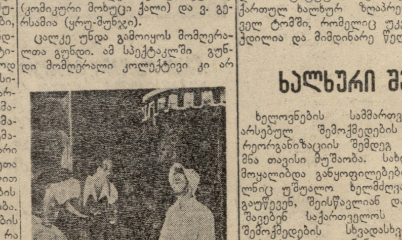
შახ. მ. ინგლო — ციცილია