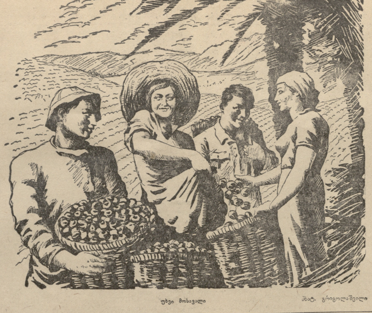
უხვი მოსავალი მშ. ბრიგადაში

ბიბლიოგრაფია: ლ. ა. „სოფლის მეურნეობა და აგროლოგიური პრობლემა“ მ. შ. შ. გულუგუშვილის მიერ „სოფლის მეურნეობა“ მისივე წიგნით.